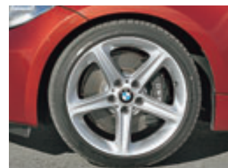
Auf großem Fuß: Serienmäßig steht der 135i auf 18-Zoll-Mischbereifung