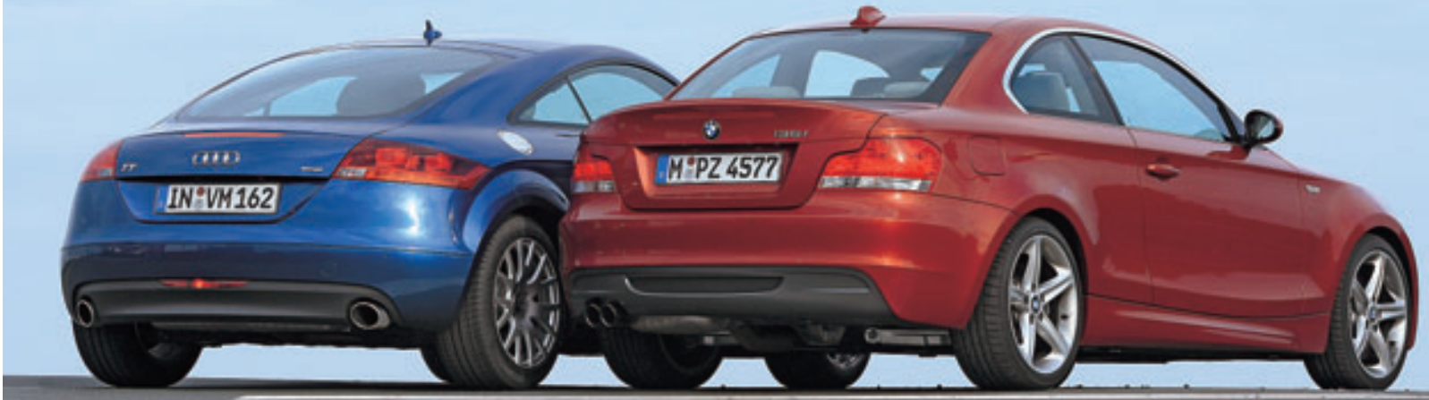
Kurvendiskussion: Der TT ist durch seine große Heckklappe praktischer. Ins Stummelheck des 135i Coupé passen dafür 80 Liter mehr Gepäck

Diese Getriebeübersetzung trägt auch dazu bei, dass der BMW beim Verbrauch vorne liegt. 12,4 Liter Super Plus gelangen pro 100 Kilometer in die Brennräume, während der Audi 13 Liter konsumiert.