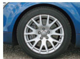
Symmetrisch: Der TT 3.2 ist rundum im Format 245/45 R 17 besohlt

fast allen Kapiteln durch. Er erinnert an die Zeiten, als unzählige BMW-Fans von einem 2002 ti träumten. Besonders die Jüngeren konnten sich damals kaum zurückhalten und werden das auch jetzt nicht machen, zumal das Preis-/Leistungsverhältnis stimmt. Der TT ist ein klassisches Coupé mit wenig Platz und guten Fahrleistungen. Straff abgestimmt, zeigt er deutlich seine Bestimmung. Spaß macht er aber auch.