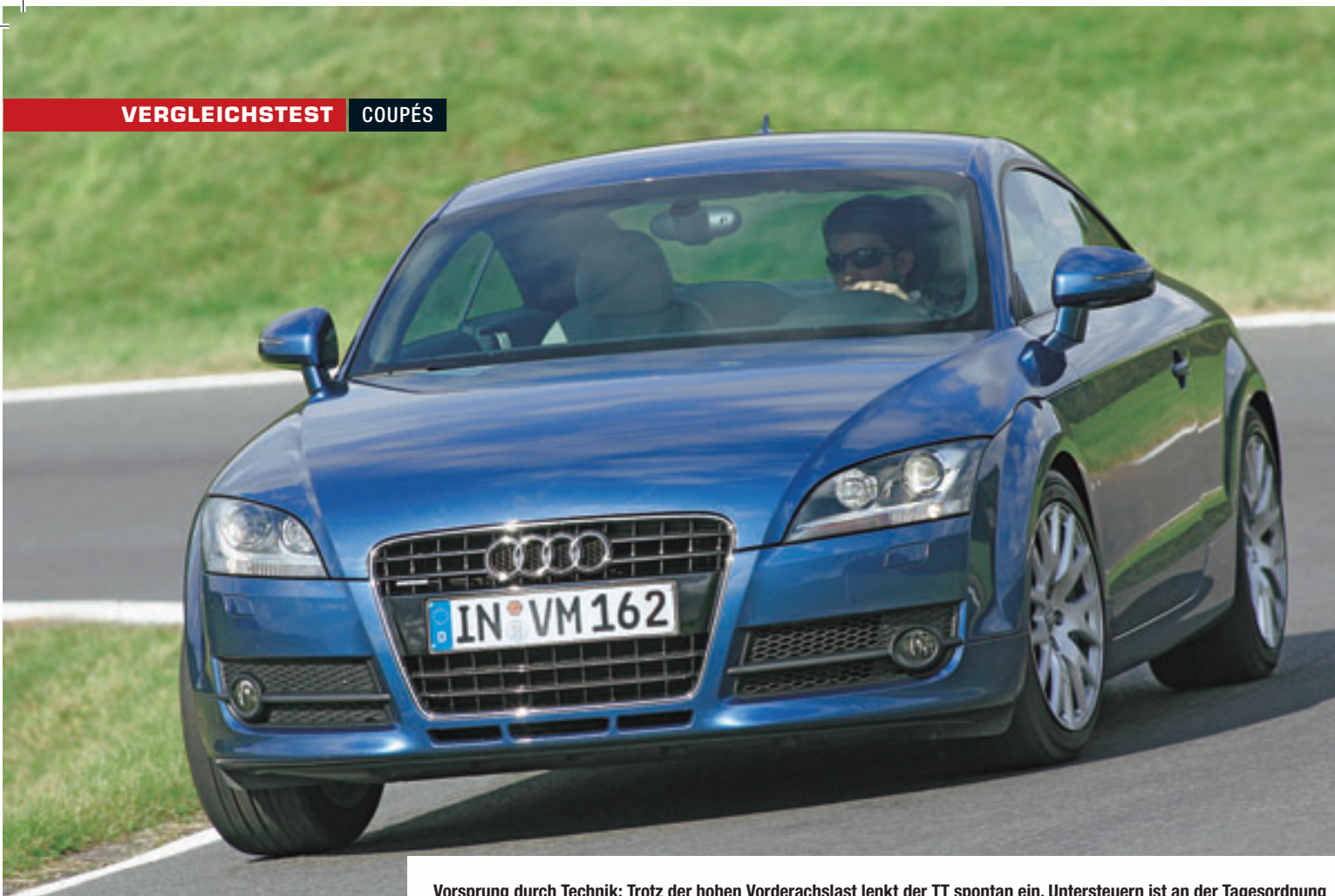
Vorsprung durch Technik: Trotz der hohen Vorderachslast lenkt der TT spontan ein. Untersteuern ist an der Tagesordnung

E motionen und Eitelkeiten sind Faktoren, die beim Kauf eines Coupés eine wichtige Rolle spielen. Vernunft ist in dieser Fahrzeugkategorie selten ein Argument. Mit dem 135i hat BMW ein leistungsstarkes Auto auf die Räder gestellt, das mit seiner ungewohnten Karosserie polarisiert. Gegner ist das klassisch gestylte Audi TT Coupé 3.2 – 306 gegen 250 PS. Auf geht's!