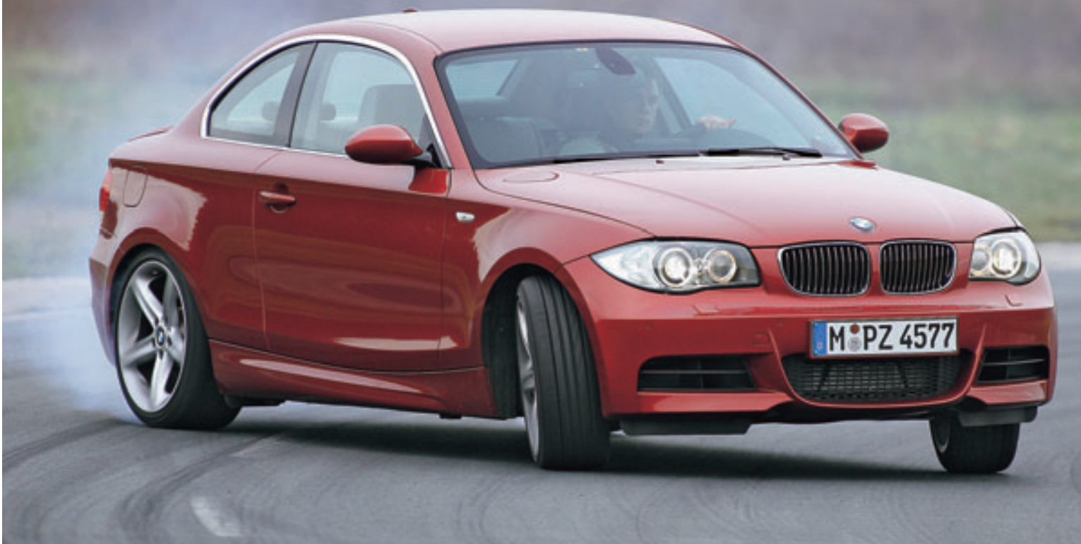
Ausnahmezustand: Gemeinhin nimmt der BMW Kurven neutral und sehr schnell. Drifts muss der Fahrer provozieren