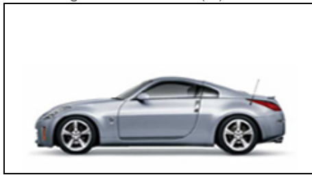
K23 New Silver Metallic (M)