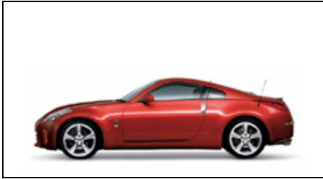
A41 Rosso (S)