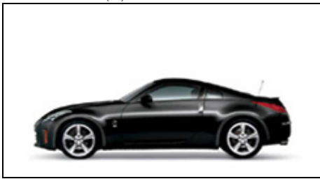
G41 Black Pearl Metallic (M)