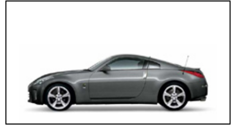
K51 Precision Grey Metallic (M)