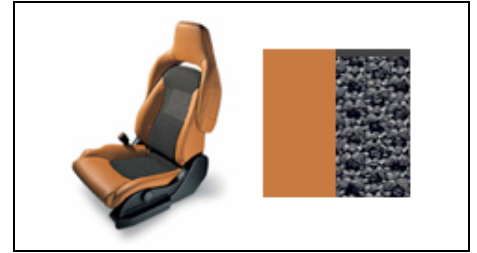
Ledersitze, Alezan-Orange (inkl. Lederpaket)