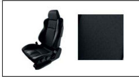
Ledersitze, Charcoal Black