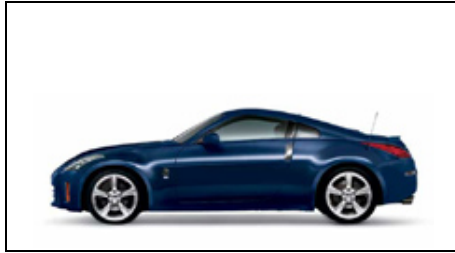
BW5 Night Blue Metallic (M)