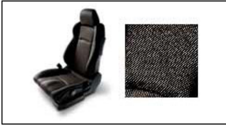
Stoffsitze, Charcoal Black