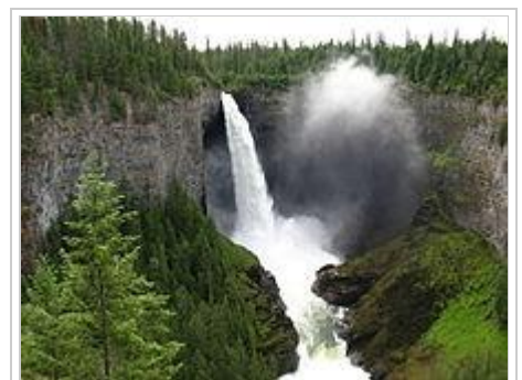
Helmcken Falls von der Südseite