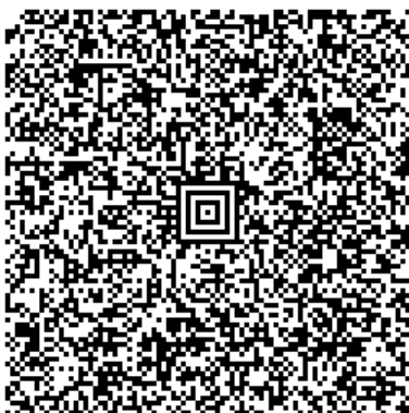
EasyTax 2013 AG 5/7