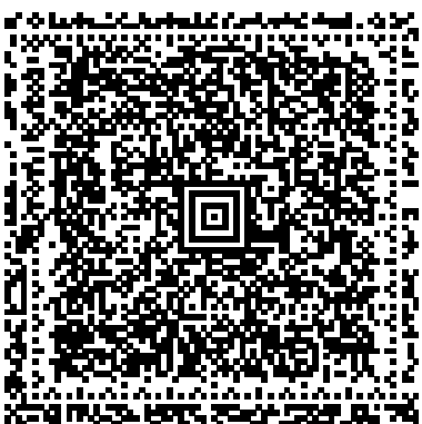
EasyTax 2006 AG 3/3