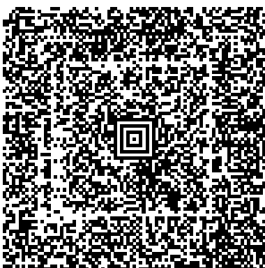
EasyTax 2006 AG 1/3

Der folgende Barcode enthält die durch Sie erfassten Daten der Steuererklärung. Das Gemeindesteueramt liest diese Daten mit einem Scanner ein. Bitte legen Sie diese/s Blatt/Blätter auch der Steuererklärung bei.